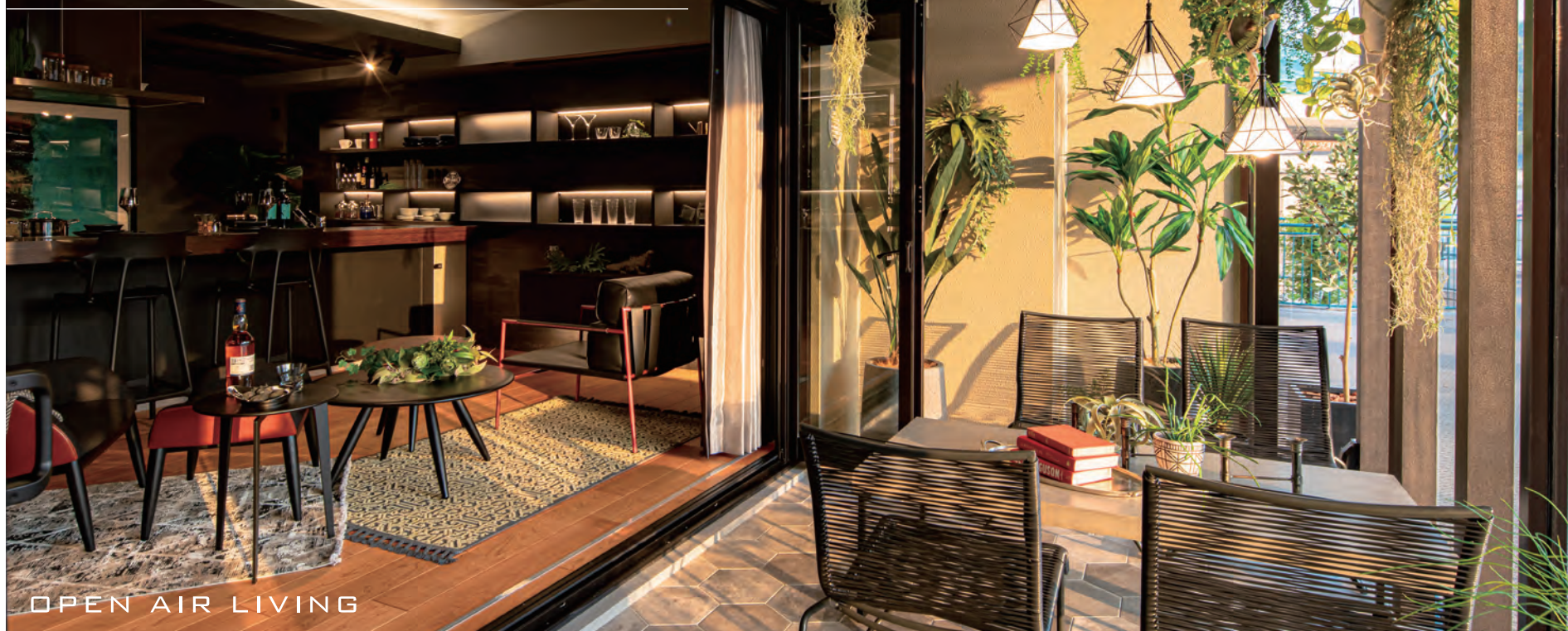
OPEN AIR LIVING