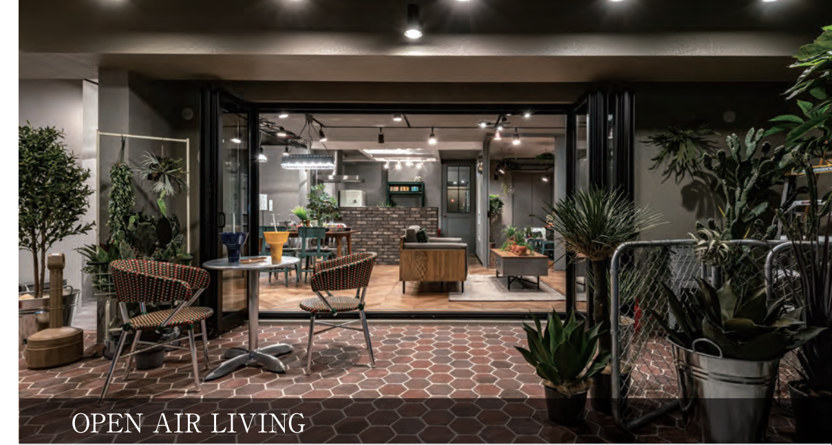
OPEN AIR LIVING

奥行2.5mのオープンエアリビングもアイデア次第で自由自在な空間へ。フルオープンサッシを全開放するとLDKも合わせて30帖弱の広大なスペースが出来上がります。