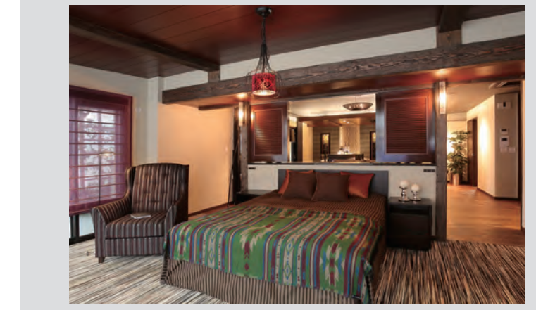
安らぎのリゾートホテル風ベッドルーム

黒を基調としたホテルライクなモダンスタイル 寝室とクローゼットがひと続きの広々とした空間となり、開放感のある斬新なお部屋となります。