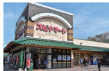
スピナマート 鞘ヶ谷店 車で約3分(約1,550m)