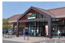
スピナサンリブ高見店 車で約3分(約1,550m)