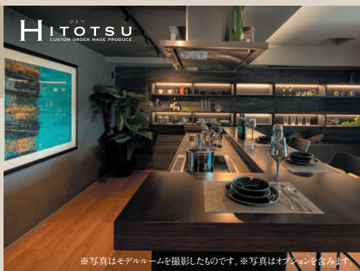
※写真はモデルルームを撮影したものです。※写真はオプションを含みません。

クロス・床・扉など、組み合わせは自由自在。あなただけのオリジナル空間をお創りいただけます。