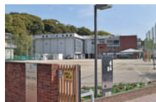
高見小学校 徒歩約14分(約1,060m)