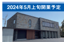
2024年5月上旬開業予定 島山整形外科スポーツクリニック 徒歩約1分(約80m)