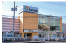
サンリブ到津 徒歩約9分(約650m)