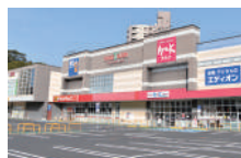
アクロスプラザいとうづ 車で約2分(約990m)