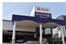
スピナ到津店 徒歩約8分(約580m)