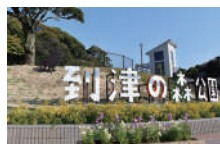
到津の森公園 徒歩約8分(約620m)