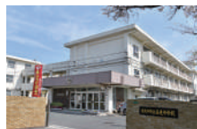
高見中学校 徒歩約8分(約570m)